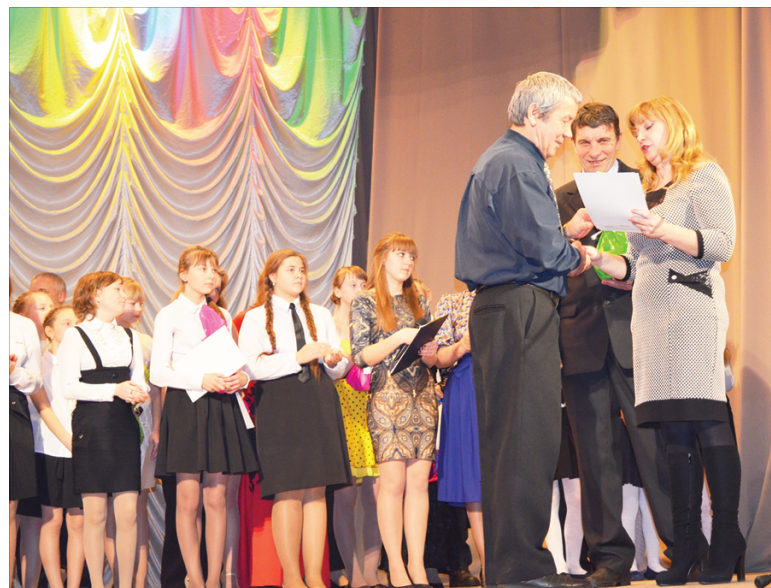
Все исполнители были награждены дипломами отдела культуры администрации района и подарками от Селижаровского отделения «Боевое братство».