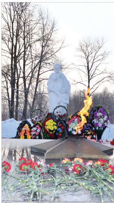
Вечный огонь. Вечная память...

День 15 января не отмечен красным днём в календаре, но для жителей Селижаровского района он всегда памятен. 15 января 1942 года посёлок Селижарово был освобождён от немецко-фашистских захватчиков бойцами 249-й стрелковой дивизии, 296-го пульбата. Более трёх месяцев наши солдаты удерживали волжский рубеж и не дали возможность соединениям немецких войск прорваться к Торжку, Кувшинову, Осташкову. В этот день традиционно звучат песни военных лет, жители района чтут память погибших, возлагают цветы и венки на братские захоронения, а в районном Доме культуры проходит фестиваль военно-патриотической песни «Нам песни эти позабыть нельзя».