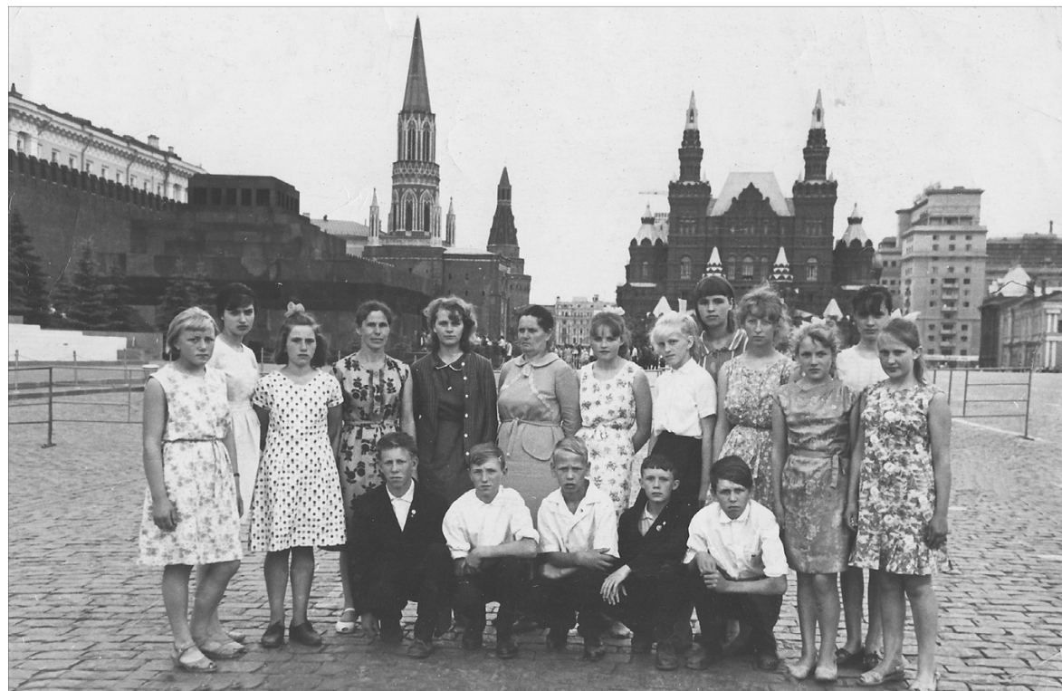
Кукушкинские школьники у стен Кремля